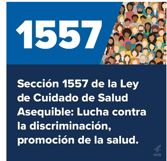
Gráfico general 16:9 para LinkedIn (1200x675px)

Todas las personas merecen una atención médica segura, competente a nivel cultural y libre de discriminación. La sección 1557 de la ACA indica que, al margen de quién sea o de dónde venga, no se puede discriminar a nadie a la hora de ir al médico o de contratar un seguro. Para obtener más información, visite HHS.gov/1557 #LucharcontraLaDiscriminación #PromoverlaSalud